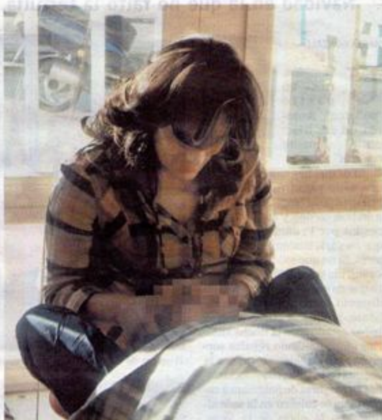
Una interna muestra las técnicas aprendidas en el centro penitenciario.

Y no hay nada más agradecido que una sonrisas y eso es lo que las personas con discapacidad de Asprodes regalaron a sus maestras después de recibir esta terapia. La actividad está integrada dentro del proyecto de cooperación entre este centro que tiene como finalidad la mejora de la calidad de vida de las personas